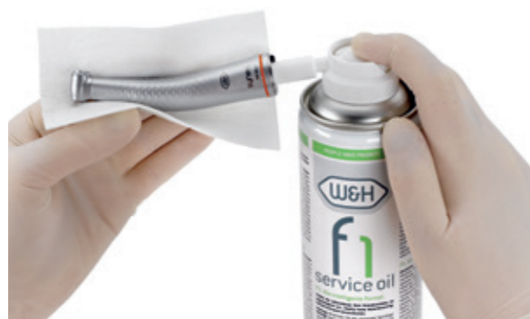
W&H Service Oil F1 в спрей-флаконт MD-400.

Сложните и прецизни технически системи се нуждаят от първокласна, висококачествена грижа: във W&H инструментите задвижващите механизми достигат максимални обороти