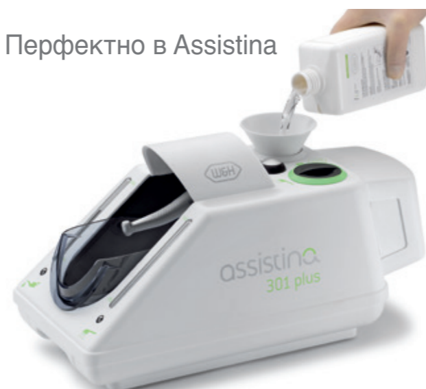
W&H Service Oil F1 в бутилка MD-500 за употреба в Assistina.

от 390 000 об./мин. F1 осигурява отлично смазване и вътрешно почистване като по този начин гарантира безупречното функциониране на инструментите.