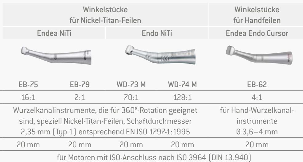
Abb. Symbolfotos. Zusatz-Ausstattung und Inhalt der gezeigten Zubehörteile sind nicht im Lieferumfang enthalten.