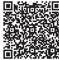
Proxeo Twist LatchShort