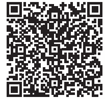
Polissage rotatif : fondé sur des données cliniques