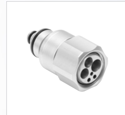
Quick RM para turbinas

Nunca antes había resultado tan fácil cambiar piezas de mano como con el revolucionario sistema Quick Connect de W&H. Basta con conectar el adaptador Quick ISO o el Quick RM para proceder al mantenimiento de todos los instrumentos de transmisión con conexión estándar ISO o de 4/6 vías. La amplia selección de adaptadores permite a Assistina ONE satisfacer los requisitos de consultas y clínicas dentales de todo tipo.